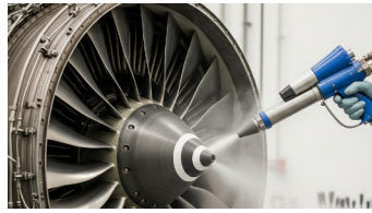
Airlines / Aerospace