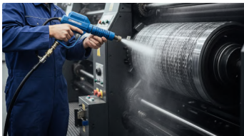
Plastics / Printing / Plating