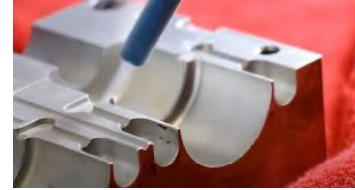
Foundries / Casting